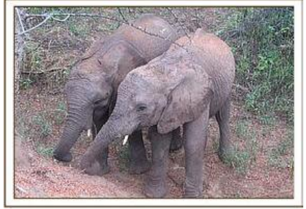
Madiba & Olmalo / 29.01.