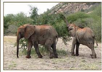
Mulika & Nasalot / 15.06.