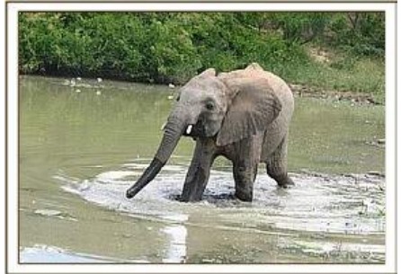
Tomboi / 14.05.