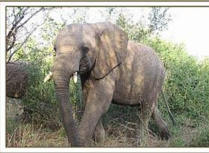
Taita / 26.06.