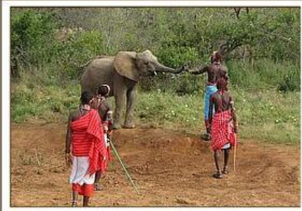
Bachuma begrüßt Samburus / 10.02.