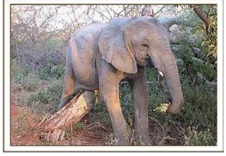
Galana / 13.05.