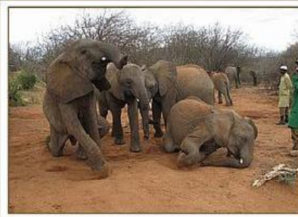
Kinna, Galana, Rapsu, Sunyei / 22.06.