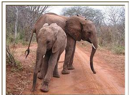
Olmalo & Yatta / 14.03.