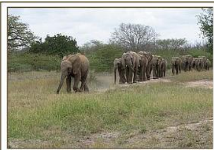
Olmalo führt die Gruppe / 06.02.