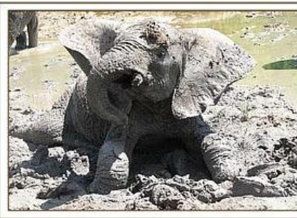
Challa im Schlamm / 05.06.