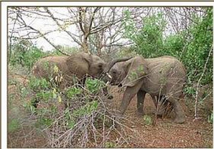
Rapsu & Kora / 10.01.