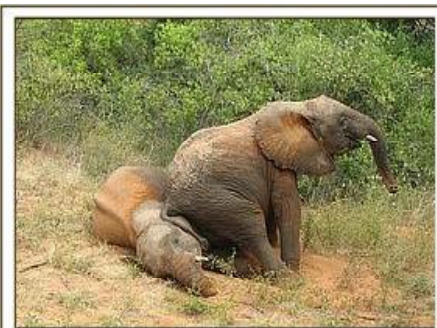
Kora sitzt auf Rapsu / 10.05.