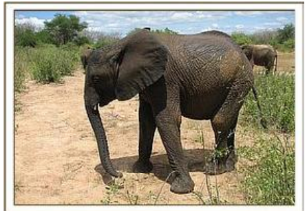
Selengai / 27.05.