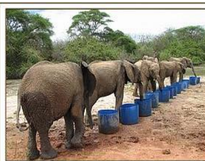
beim Trinken / 19.04.